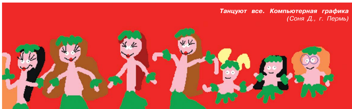
Танцуют все. Компьютерная графика (София Д., г. Пермь)

Миф 7. У аутистов нет чувства юмора. Они воспринимают все слишком буквально и не понимают таких вещей, как шутилка перепалка или дружеское подтрунивание. Однако высокофункциональные аутисты могут понимать и наслаждаться юмором, в том числе и очень тонким.