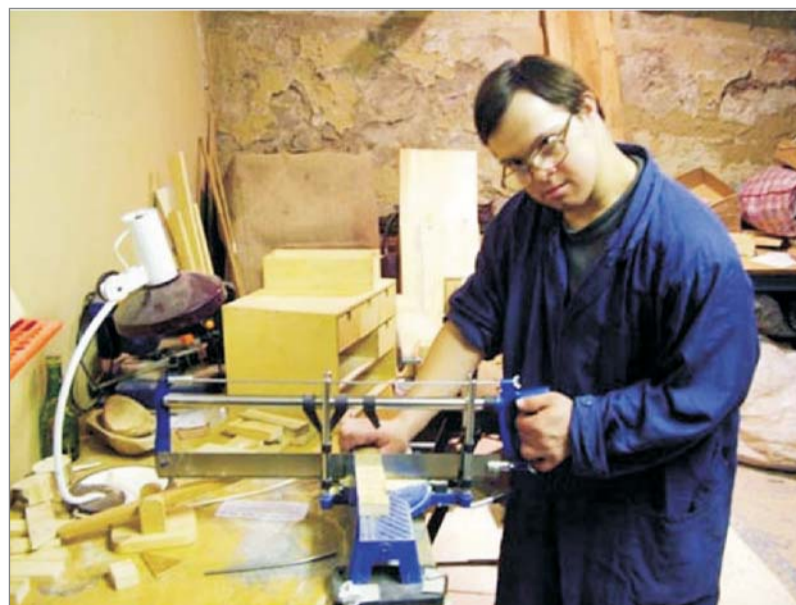
Ткацкая, керамическая, столярная мастерские центра «Турмалин»

В пекарне каждое утро пекут свежий хлеб для всех жителей. Питание пятиразовое – помимо завтрака, обеда и ужина, двухразовое чаепитие с выпечкой. Баня – в пятницу вечером, которая используется в оздоровительных целях – в домах самые комфортные условия: горячая вода, ванна, стиральная машина-автомат, современные кухни. В субботу до обеда – уборка личных комнат и общих помещений, после – свободное время, которое, как и в воскресенье, посвящают художественным занятиям. Поселение входит во всемирное движение Camphill, основателем которого является австрийский ученый доктор Карл Кёниг.