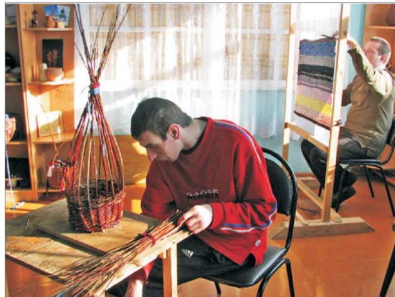
Организация труда подопечных в ООО «Отрадный сад»

Прибайкальская общественная организация инвалидов «Центр деятельности «Отрадный сад» создана для реабилитации детей-инвалидов, достигших 18 лет. «Отрадный сад» – это поселение инвалидов, работающее на основе методов