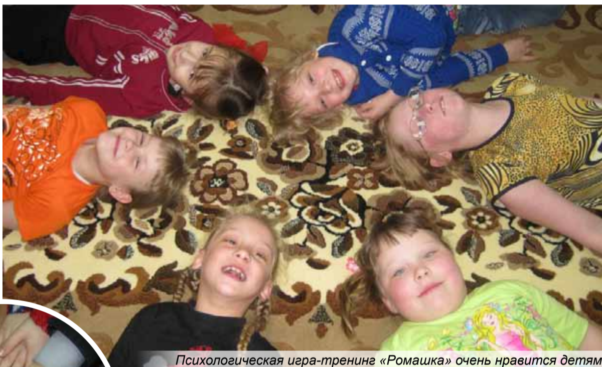
Психологическая игра-тренинг «Ромашка» очень нравится детям.