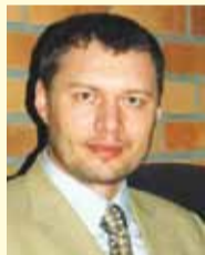
Депутат Государственной думы ФС РФ Константин Бесчетнов.

Для России такой механизм социального предпринимательства достаточно необычен, тогда как аналогичные магазины уже более полувека успешно работают в странах Европы.