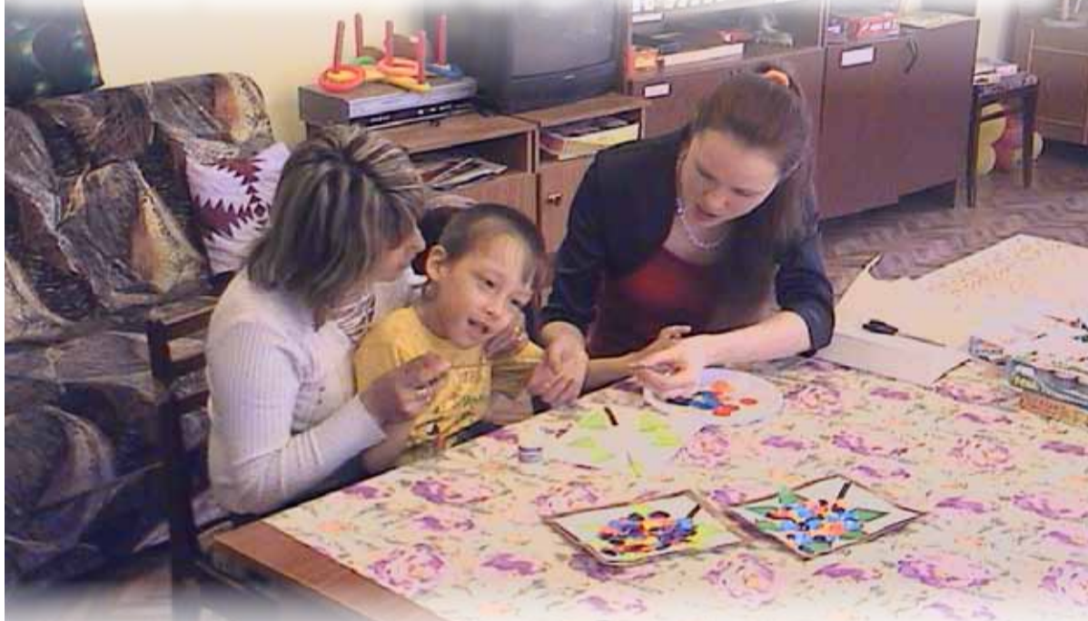
Арт-терапия позволяет ребенку выразить себя, пережить состояние успеха и почувствовать важность своего мира для других. Продолжение темы читайте на с. 2.