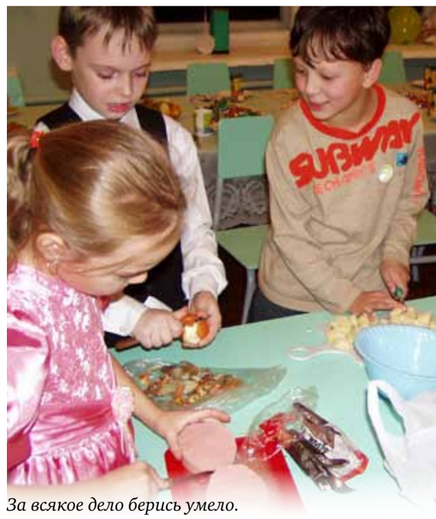
За всякое дело берись умело.

вить простые блюда, которые они с удовольствием съедают, угощая сотрудников центра и своих родителей. В процессе учебы у них формируются навыки, благодаря которым они учатся быть более самостоятельными и независимыми.