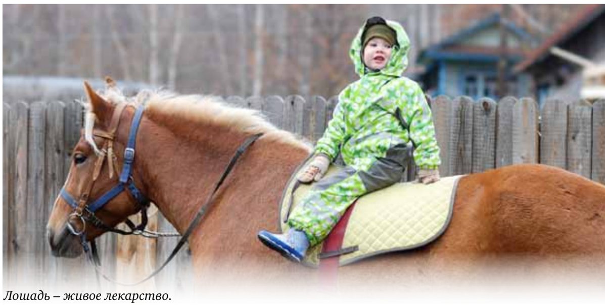
Лошадь – живое лекарство.