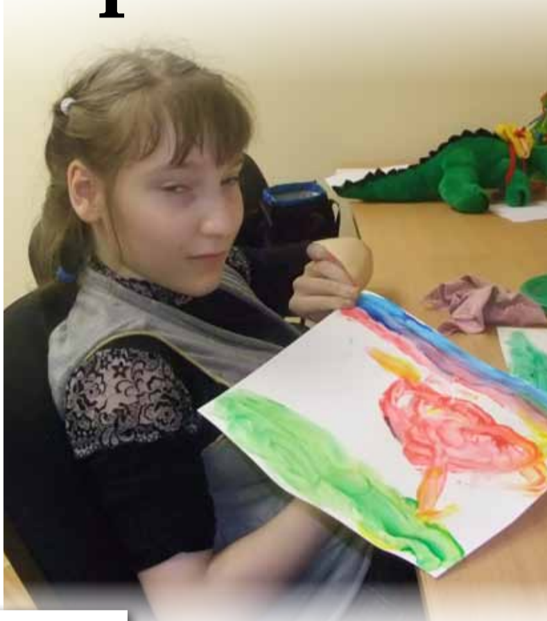
В процессе творчества ребенок гораздо ярче и нагляднее проявляет себя.

Арт-терапевтические занятия способствуют более ясному,